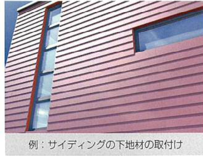
例：サイディングの下地材の取付け