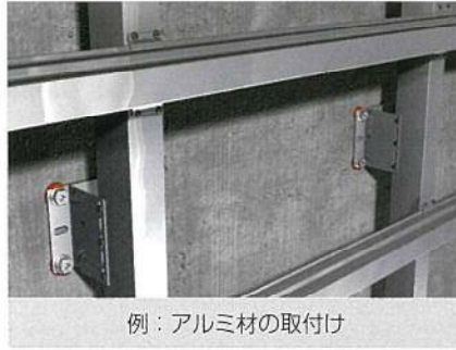
例：アルミ材の取付け