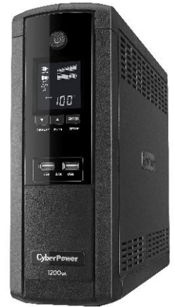
Backup BR 375