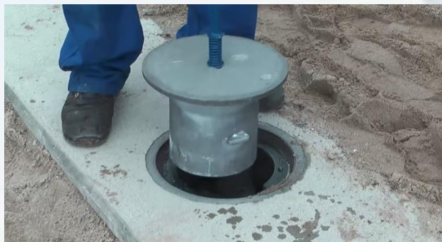
① 円柱ポケットカバーを取り抜きます。