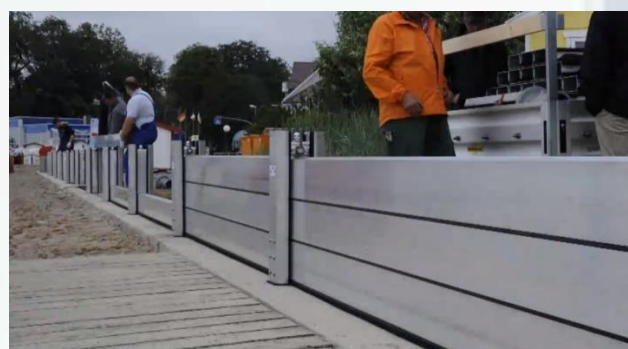
④ U型支柱の間にアルミパネルを差し込みます。