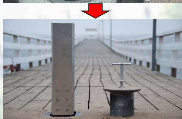
③ 支柱をロックします。