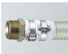
谷埋め・フープバンド締め (M1金具付き)