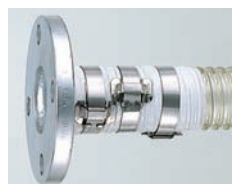
谷埋め・フープバンド締め (JISフランジ付き)