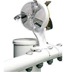
ホワイト色 (自掃式仕様)