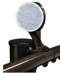
ダークブラウン色 (自掃なし仕様)