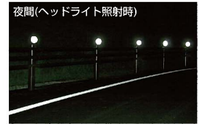
夜間(ヘッドライト照射時)