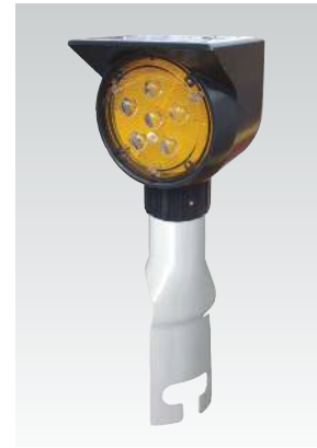
ガードレール・ガードパイプ差込式 金具もご用意しました。 (φ114.3、φ139.8 兼用)