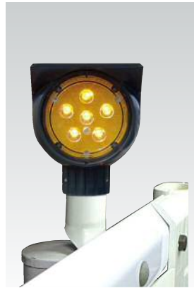
ガードレール施工例 (差込式金具使用)