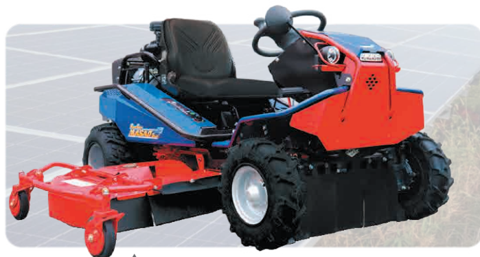
スライドさせている状態