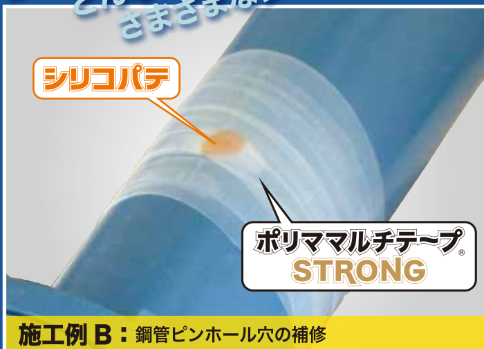
施工例 B：鋼管ピンホール穴の補修