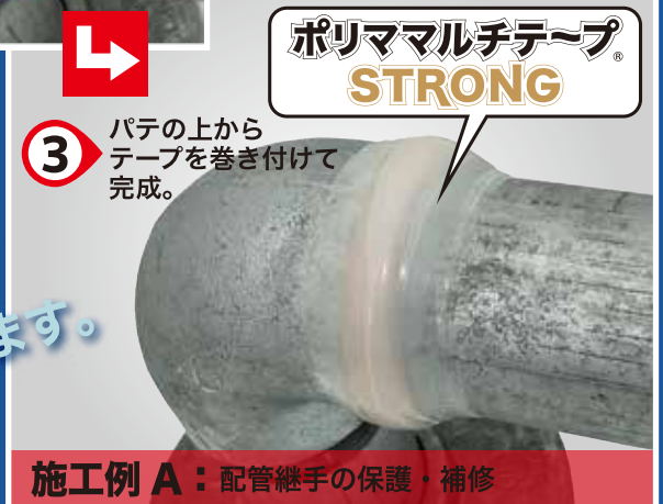
施工例 A：配管継手の保護・補修

硬くならずいつでも適量を手にとって どんな形状にも練りこめるから、 さまざまなシーンに応用できます。