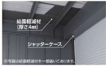
④写真は結露軽減材を一部省いてあります。

結露軽減材は結露の発生を止めるものではありません。詳しくはP.123 ③をご参照ください。