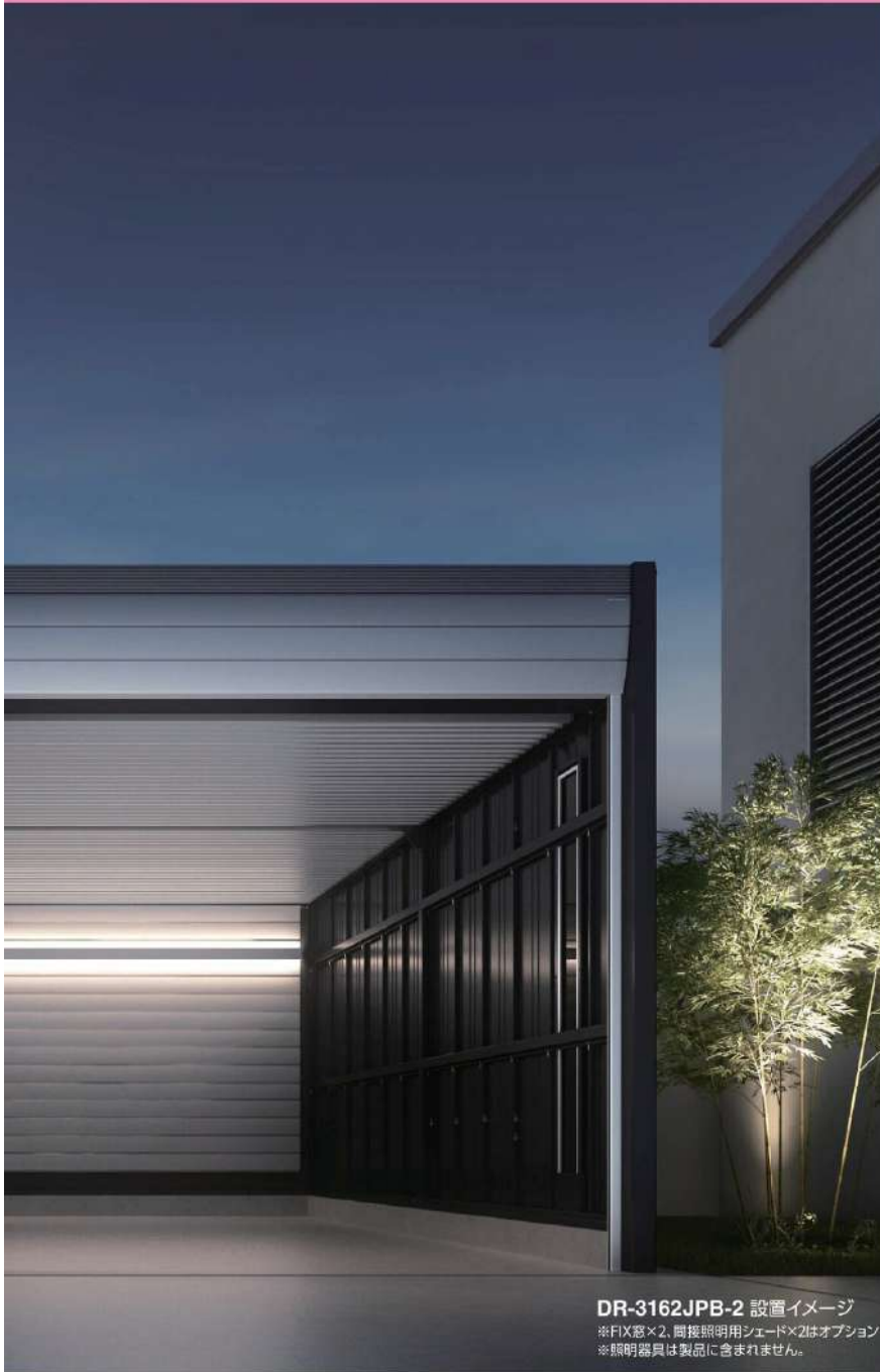
DR-3162JPB-2 設置イメージ ※FIX窓×2、間接照明用シェード×2はオプション ※照明器具は製品に含まれません。