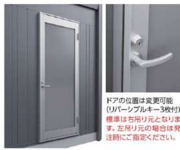
ドアの位置は変更可能 (リバーシブルキー3枚付) 標準は右吊り元となります。 左吊り元の場合は発注時にご指定ください。

操作性に優れたレバーハンドル付きアルミ製ドアを標準装備。光をやわらかく採り入れ、目隠し効果を備えた型板強化ガラスを採用しています。