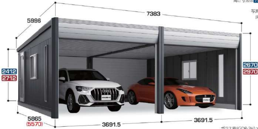
ガラス窓(GDR-2H)×2、FIX窓×2はオプション

2連棟 (2台収納タイプ) 高さ寸法は ハイルーフ ジャンボ です。 ( )は本体内部奥行寸法 写真は一般型TypeB ハイルーフ 床面積:42.58㎡ (12.90坪)