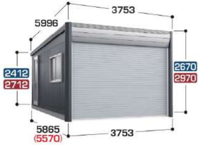
ガラス窓(GDR-3H)はオプション

基本棟 (1台収納タイプ) 高さ寸法は ハイルーフ ジャンボ です。 ( )は本体内部奥行寸法 写真は一般型TypeA ハイルーフ 床面積:21.29㎡ (6.45坪)