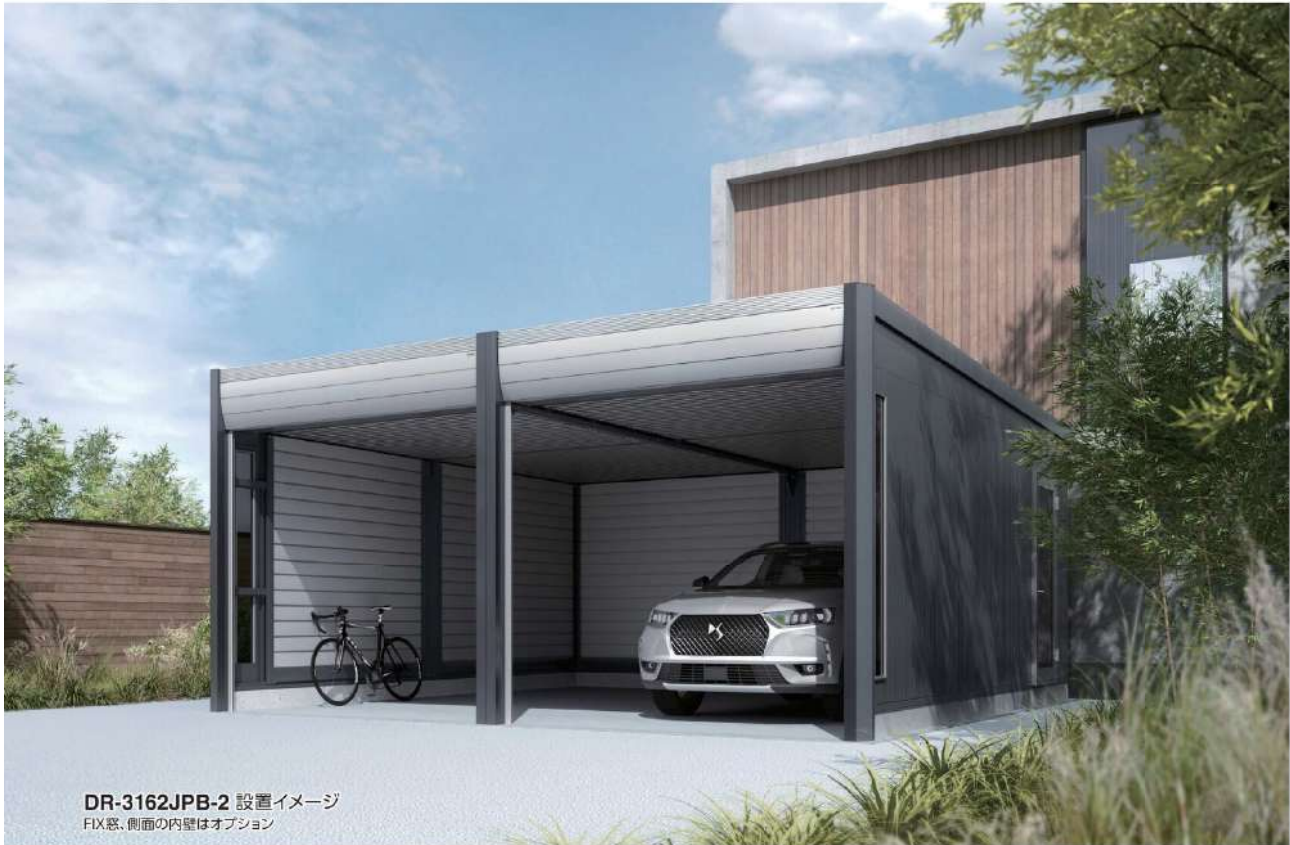
DR-3162JPB-2 設置イメージ FIX窓、側面の内壁はオプション