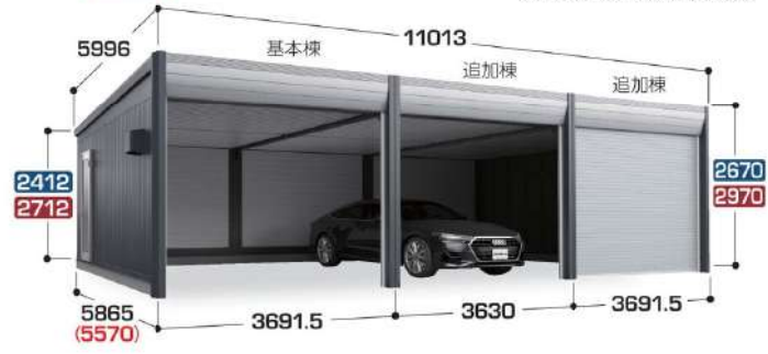
フード付20cm換気扇取付パネルはオプション

追加棟 (2台目以降収納タイプ) 高さ寸法は ハイルーフ ジャンボ です。 ( )は本体内部奥行寸法 写真は一般型TypeB ジャンボ 床面積:21.29㎡ (6.45坪)×連続数