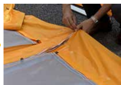
接続用と止水用のファスナーを閉める