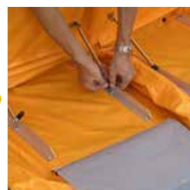
フックを掛けて立ち上げる