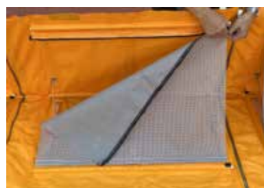
メッシュシートのファスナーを閉める