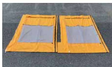
デルタパネルを並べる

組立は、パイプを挿入し、立ち上げてメッシュシートをファスナーを閉めるだけ。 デルタパネル同士はファスナーで素早く接続が可能。 コーナー用と端部シートを組み合わせることで、設置場所の形状に合わせて設置することができます。