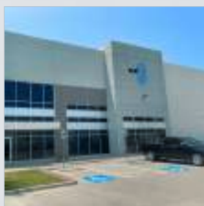
北米 ビジネス開発セ ンター