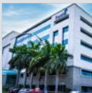
インド 海外カスタマー サービスセンタ ー