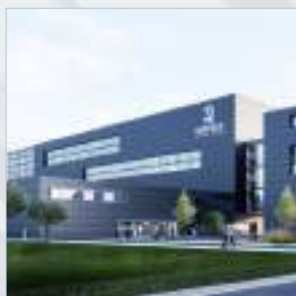
北京 (亦莊) 公園