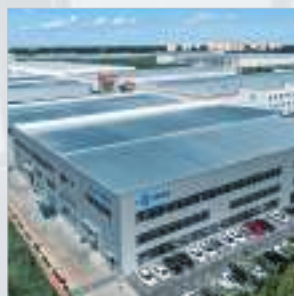
天津 インテリジェン ト製造センター