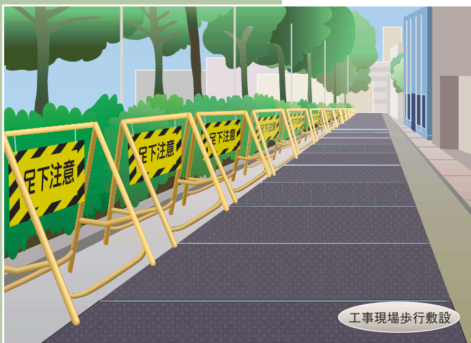
工事現場歩行敷設