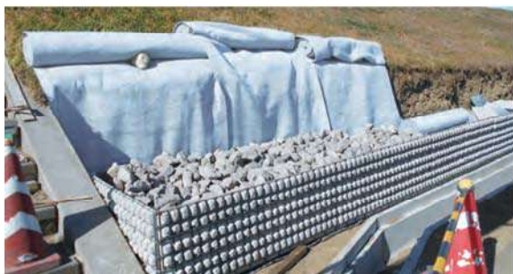
のり尻ドレーン工 (EGドレーン使用)