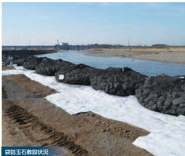
袋詰玉石敷設状況