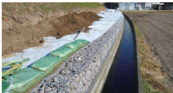
のり尻ドレーン工 (かご使用)