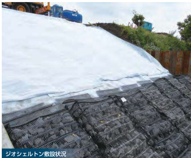
ジオセルトン敷設状況