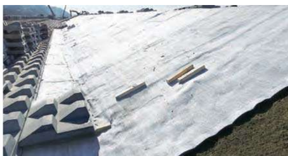
河川護岸(川表) ブロック敷設状況