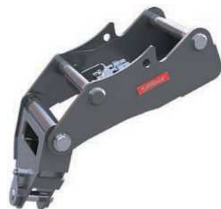
揺動式アダプター (林業用アタッチメント他用)