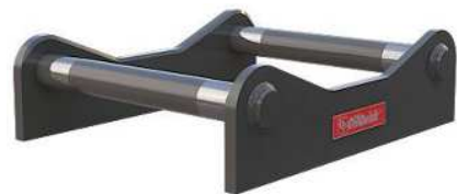
機械式フレーム (溶接用)