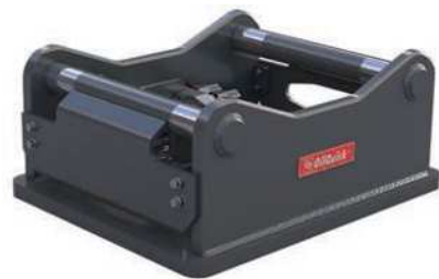
油圧式プレート (ボルト留め用)