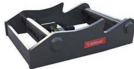
油圧式フレーム (溶接用)