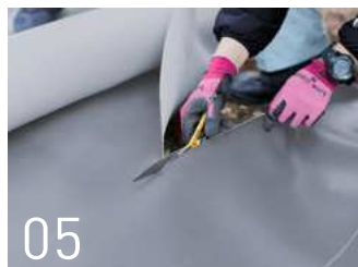
現場サイズに合わせて採寸