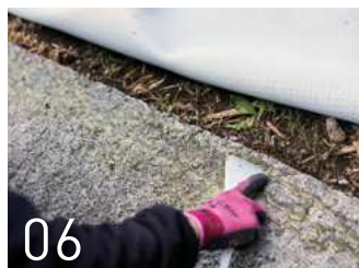
コンクリート部への接着剤塗布