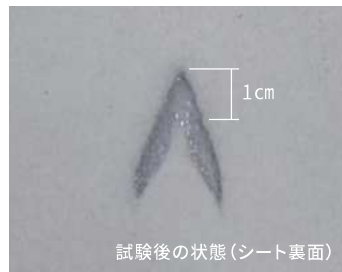
試験後の状態(シート裏面)