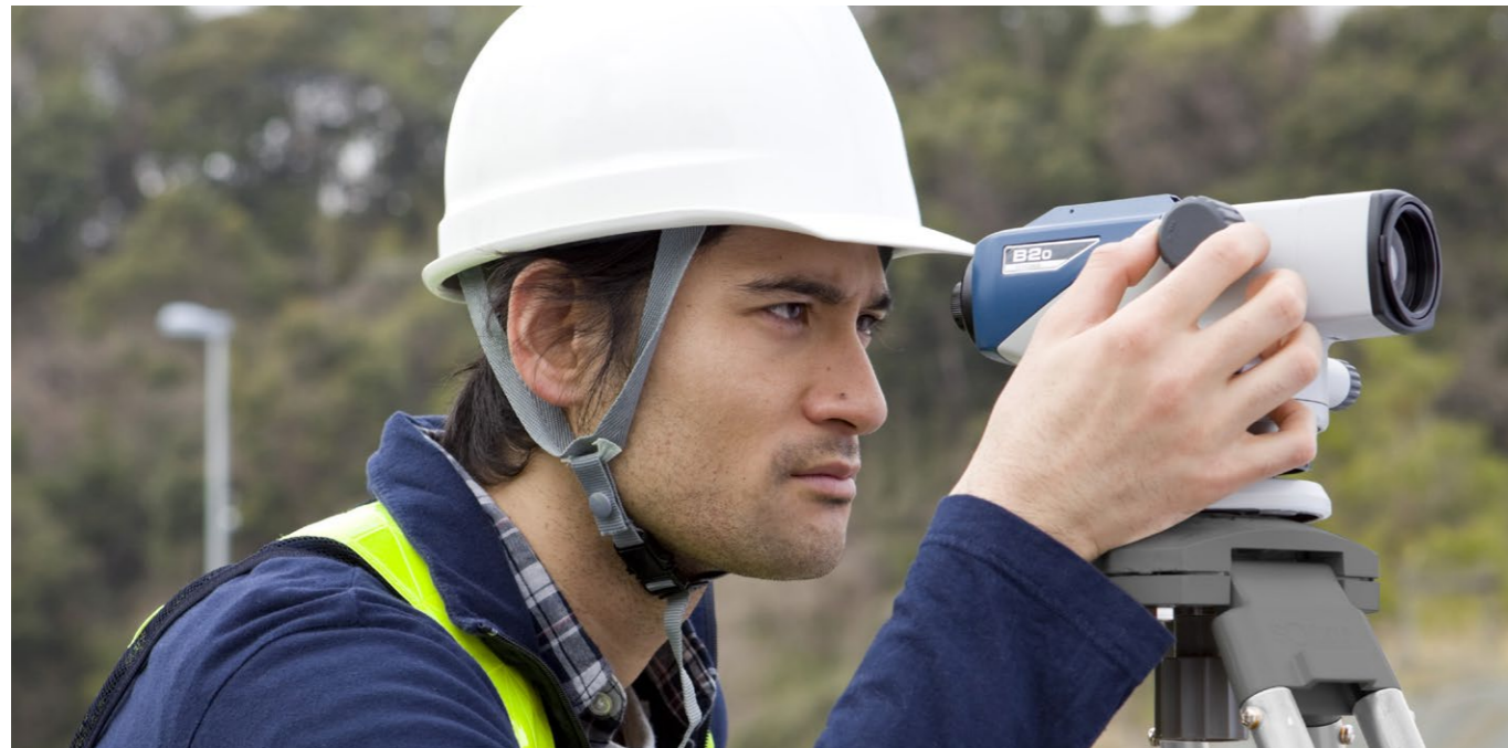
高倍率の高精度モデル