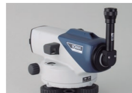
ダイアゴナルアイピース DE16 (B2o)

接眼部に取付けることにより、90度方向からのぞくことができます。低位置での観測や、狭い場所での観測に便利です。