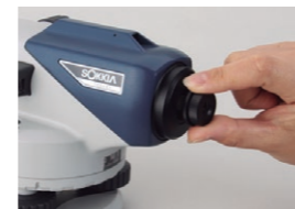
40x 接眼レンズ EL5 (B2o)

望遠鏡に光学マイクロメーターを取り付けることにより、0.1mm まで高さを読取ることが可能となります。精密な水準測量として、工作機械の据付等、高精度が要求される作業に活用いただけます。また、光学マイクロメーターと合わせて機器検定を受けることで、公共測量の2級水準測量を行うことができます。