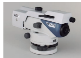
光学マイクロメーター OM5 (B2o)

接眼部に取付けることにより、90度方向からのぞくことができます。低位置での観測や、狭い場所での観測に便利です。