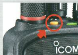
緊急呼び出しボタン

緊急呼び出しボタンを押すことで、あらかじめ設定した端末に一齐に緊急信号を送出できます。